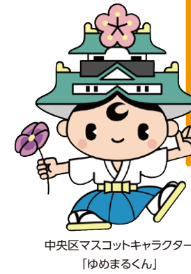
中央区マスコットキャラクター 「ゆめまるくん」